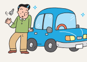
車を始めとする各種ローン