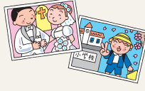
お子様の教育費・結婚費用