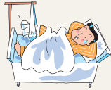
病気・ケガの医療費 etc